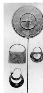
Aros y Tup 