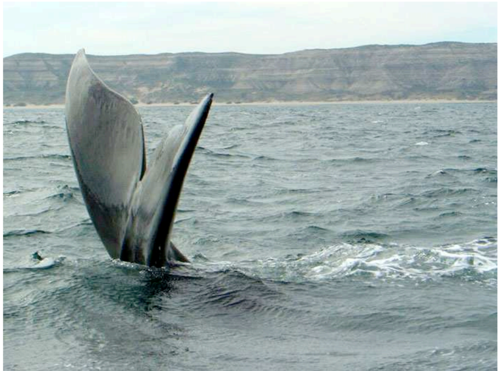
Ballena Franca Austral

Tiernas escenas de saltos en el océano, entre madres y crías. La Ballena Franca Austral empieza a llegar a estas costas a partir de los meses de mayo o junio, hasta principios de diciembre, que marchan hacia el sur en busca de alimentos.