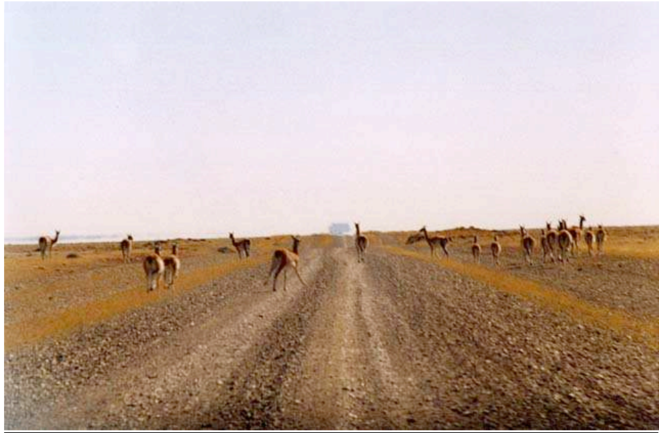
Manada de guanacos cruzando la mítica Ruta 40.

Tierra desolada, con poblaciones distantes, unas de otras, e incansables caminos de ripio. En cada uno de ellos, un paisaje diferente. Mar, meseta y montaña, todo en un mismo territorio. Con el encanto de lo intocado por el hombre y su gran extensión nos cautivan.