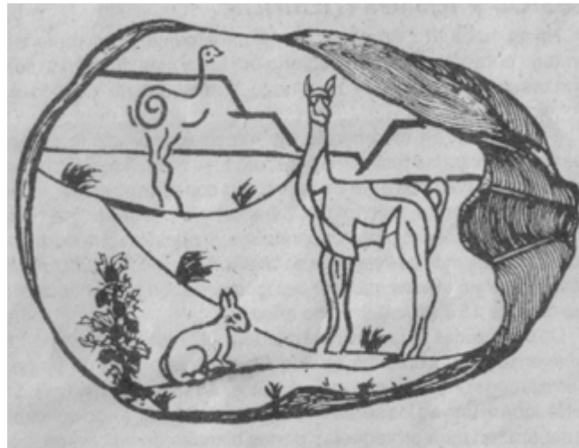
Representación de fauna y flora típica. Choique, guanaco, Mara. Vegetación seca, Mata barrosa.

Ejemplo de tesón y de conquista, son los colonos galeses que llegaron a las costas de Península Valdés y retomando el curso del río Chubut fueron poblando la región.