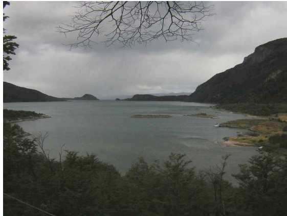
Bahía Lapataia, P. N. Tierra del Fuego

En el Río Lapataia se practica la pesca deportiva de truchas y salmones.